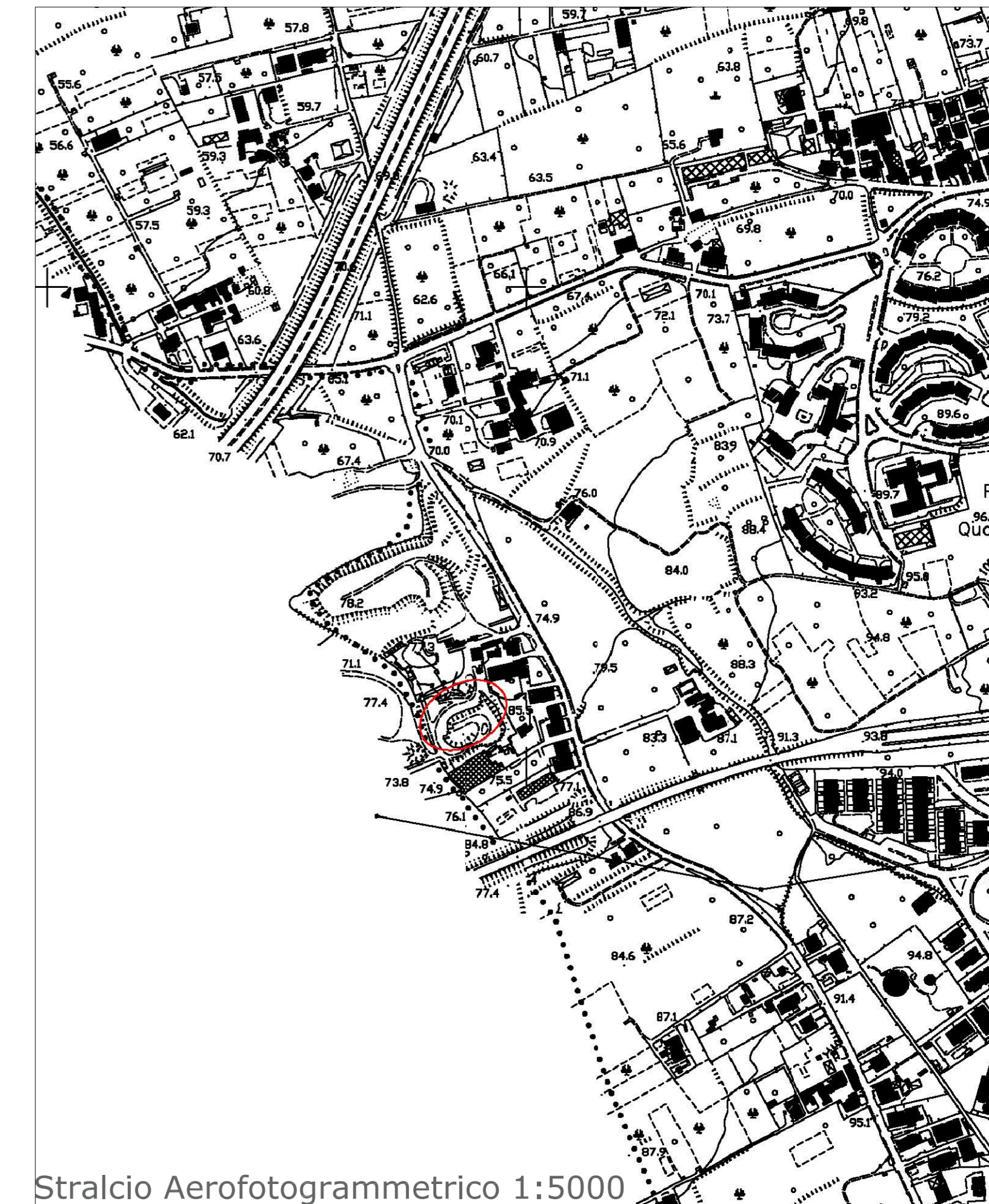
Stralcio Aerofotogrammetrico 1:5000